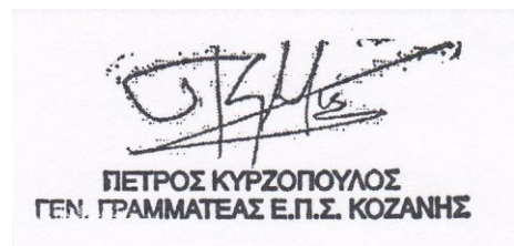
ΠΙΕΤΡΟΣ ΚΥΡΙΟΠΟΥΛΟΣ ΓΕΝ. ΓΡΑΜΜΑΤΕΑΣ Ε.Π.Σ. ΚΟΖΑΝΗΣ

Ε.Π.Σ. Κοζάνης © 2018 - Με την ευγενική χορηγία